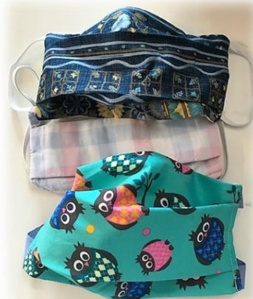
Un petit échantillon de leurs réalisations

Au total plus de 250 masques adultes et enfants confectionnés selon les normes Afnor ont pu être distribués par le comité des solidarités, auxquels se sont ajoutés les deux « masques pour tous ». Un grand merci et bravo pour ce bel élan de solidarité !